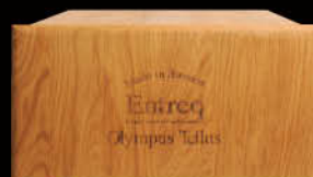
Olympus TellUs 40W x 21H x 50D/cm 46kg