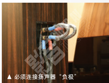
▲ 必须连接扬声器“负极”